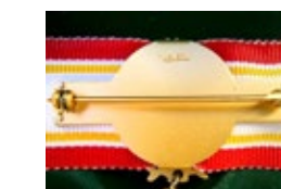
Рис. 2. Медаль имени Флоренс Найтингел (аверс, реверс колодки)