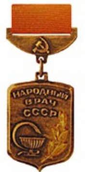
Рис. 11. Знак «Народный врач СССР»

Лицам, удостоенным звания «Народный врач СССР», вручались грамота Президиума Верховного Совета СССР и нагрудный знак установленного образца, носимый на правой сторо-