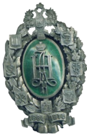
Рис. 10. Знак «50 лет Земству 1864-1914»