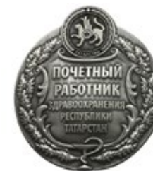
Рис. 5. Знак «Почетный работник здравоохранения Республики Татарстан» (аверс)

К этой группе относятся знаки, выпущенные крупными общественными организациями нашей страны, местными (региональными) органами власти, а также организациями. В первую очередь, это награды Союза Обществ Красного Креста и Красного Полумесяца СССР, награды Российского Красного Креста. Во времена СССР многие республиканские власти учреждали свои награды медикам. Например, знаки «Заслуженный врач» вручались практически повсеместно. В наши дни в ряде регионов России эта традиция сохранилась. Так среди прочих почетных знаков существуют награды «Заслуженный врач Республики Татарстан» и «Почетный работник здравоохранения Республики Татарстан» (рис. 5), «Заслуженный врач Республики Армения» и «Почетный работник здравоохранения Республики Армения» (рис. 6) и др.