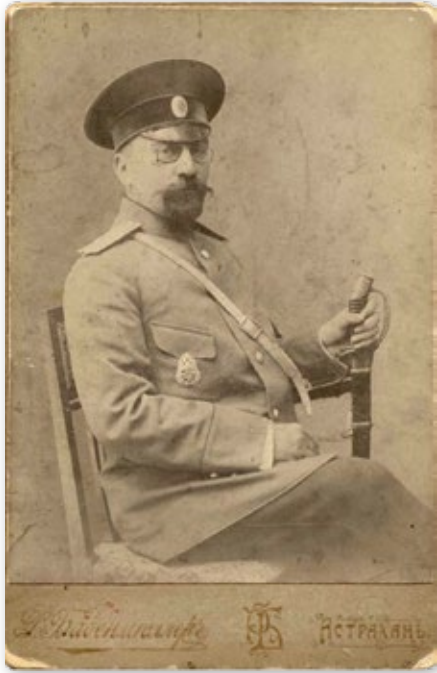
Военный врач, коллежский советник (6 кл.). Знак «Императорская военно-медицинская академия».