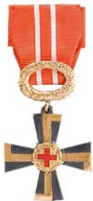
Рис. 4. Крест 3-го класса Ордена Креста Свободы (аверс)

Наградные знаки – ордена и медали, а также знаки и значки, учрежденные государством или органами государственной власти для награждения, знаки и медали, учрежденные международными организациями для медицинских работников.