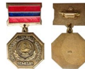
Рис. 6. Знак «Заслуженный деятель Армянской ССР». (аверс и реверс) (ЛМД)