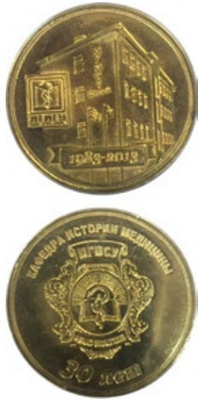
Рис. 3. Настольная медаль «30 лет Кафедры истории медицины МГМСУ им. А.И. Евдокимова», 2013 г. (аверс, реверс)