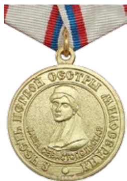
Рис. 14. Нагрудный знак Даши Севастопольской (авверс)

Нагрудным знаком Н. И. Пирогова награждаются: деятели Российского Красного Креста, здравоохранения и социальных служб, работники региональных и структурных подразделений РКК за заслуги в развитии гуманной деятельности РКК, медицинские работники, патронажные медицинские сестры, доноры, активисты за активную работу по охране здоровья населения, другие лица, проявившие самоотверженность при оказании медицинской и другой помощи пострадавшим при стихийных бедствиях и несчастных случаях. Нагрудным знаком Н. И. Пирогова могут награждаться иностранные граждане, активно способствующие развитию гуманной деятельности РКК. Нагрудный знак Н. И. Пирогова представляет собой круг желтого металла в диаметре 25 мм, с надписью по краю Н. И. Пирогов (слева) 1810 – 1881 (справа) с портретом Н. И. Пирогова посередине. Нагрудный знак прикрепляется к планке размером 10x15 мм с полоской белого, красного, синего цветов.