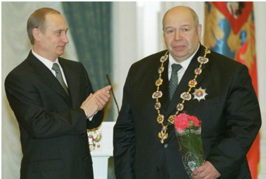
Награждение – Президентом Российской Федерации В. В. Путиным Орденом Святого апостола Андрея Первозванного В. И. Шумакова – заведующего кафедрой трансплантологии МГМСУ, 2002 г.