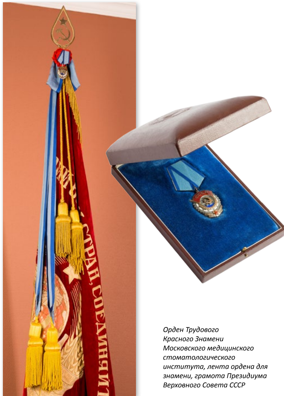
Орден Трудового Красного Знамени Московского медицинского стоматологического института, лента ордена для знамени, грамота Президиума Верховного Совета СССР