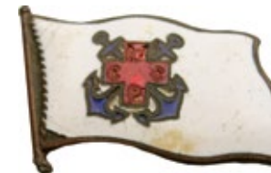
Рис. 8. Знак «Флаг Общества спасения на водах» (аверс)

Например, знак для лиц сдавших кровь – доноров.