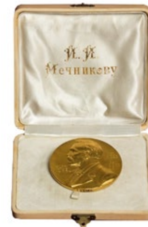
Рис.1. Медаль Ильи Мечникова.

Особый раздел – это настольные медали (рис. 3). Отливать медаль по случаю юбилея ученого или в память о событии стало многолетней традицией, причем не только в России, но и за рубежом. В музее медицины в Риме есть великолепная коллекция таких медалей, в собрании Рижского музея медицины