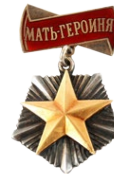
Рис. 15. Орден «Мать-героиня» (авверс)

Эта тема требует отдельного подробного анализа с использованием иллюстративного материала и приведением нормативных документов.