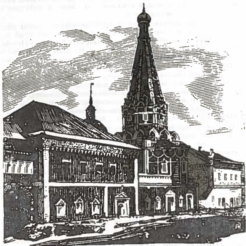
Рис. 4. Больничные палаты. Троице-Сергиева лавра (XVII в.).

После образования Московского государства организация медицинской помощи населению и воинам постепенно переходит в руки государства.