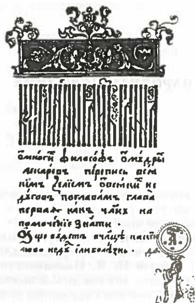
Рис. 1. Лечебник русский, 2-я половина XVII в.

что церковь вела постоянную борьбу с народными врачевателями, а летописи создавались, как правило, при монастырях. Составители же лечебников и травников своих имен не оставляли.