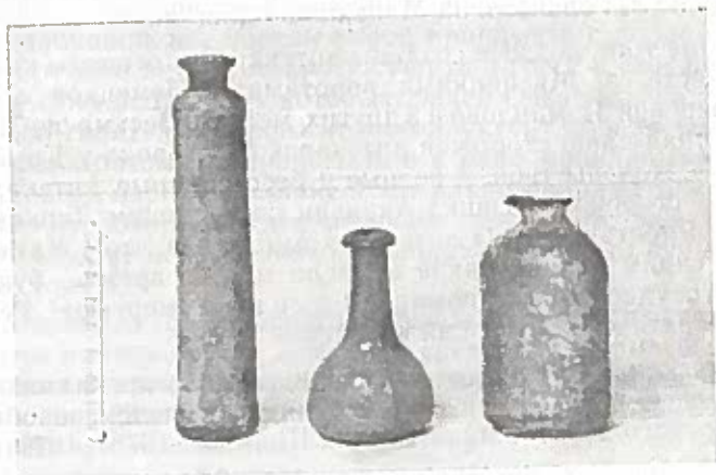
Рис. 6. Аптекарская посуда (XVII в.), найденная в Москве при раскопках.

Согласно Указу Петра Первого (1706) в Москве было открыто еще 8 аптек. Первая из них находилась вблизи нынешней станции метро «Бауманская», в Аптекарском переулке, вторая на Никольской ул. (ул. 25 лет Октября), третья у Покровских ворот, четвертая у Арбатских ворот.