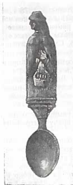
Рис. 5. Деревянная ложка для приема лекарств (XVII в.). Ручка ложки изображает фигуру врача, держащего в руке «Корзинку с надписью «лекарь».

В Москве на средства боярина Ртищева была сооружена в 1656 г. небольшая гражданская больница из двух палат. В 1635 г. при Троице-Сергиевом монастыре был построен комплект больничных палат. Эти двухэтажные больничные палаты сохранились до настоящего времени. Они «...состоят из нескольких самостоятельных объемов, перекрытых высокими крышами. Маленькие окна с наличниками живописно располагаются по фасадам, расчлененных лопатками и междуэтажными тугами и увенчаны сложным узорчатым карнизом; часть окон имеет не арочные, а характерные для XVII в. горизонтальные перекрытия» 1 . Монастырские больничные корпуса