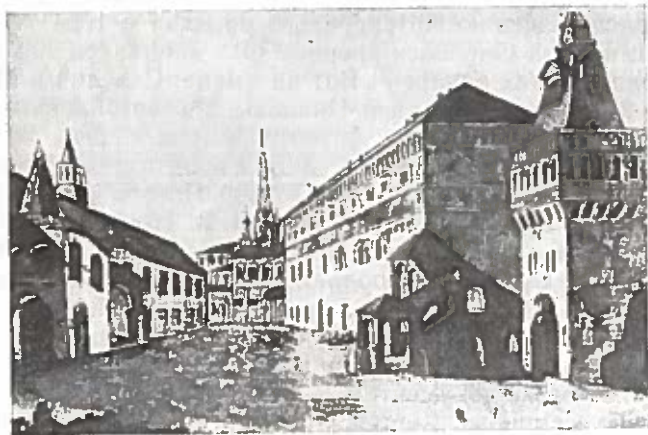
Рис. 2. Здание Аптекарского приказа в Кремле (XVII в.).

Место размещения Аптекарского приказа не было постоянным. Первоначально это учреждение находилось на территории Кремля в каменном здании напротив Чудова монастыря. Во 2-ой половине XVII в. основные службы Аптекарского приказа перемещены на новое место. В книге расходной за 1657 год есть такая запись: «...Царь и Великий князь Алексей Михай-